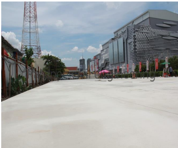
ลานคอนกรีต