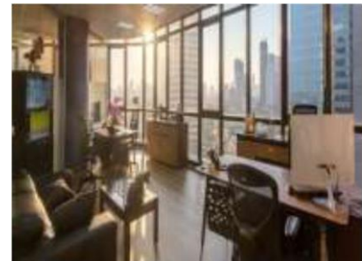
สำนักงาน