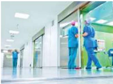
สถานพยาบาล