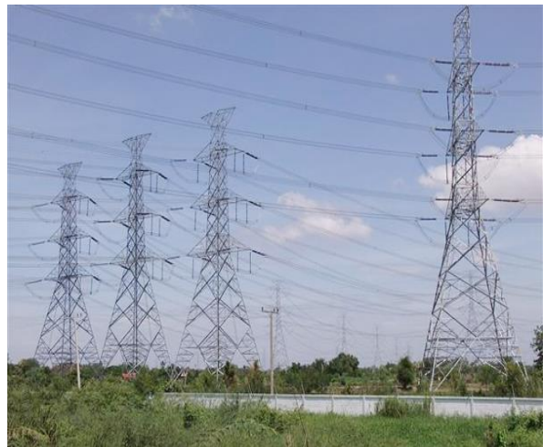
เสาไฟฟ้า