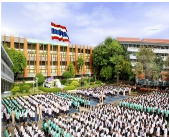
สถานศึกษา