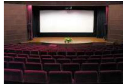
โรงมหรสพ