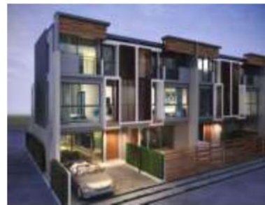
บ้านแถว (ทาวน์เฮาส์)