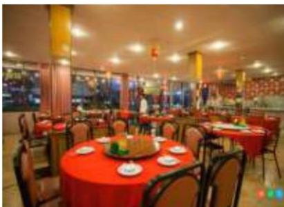
ภัตตาคาร