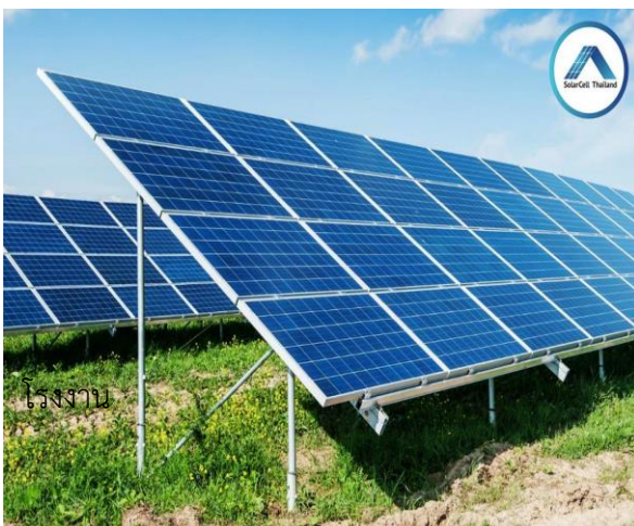
แผงโซลาร์เซลล์