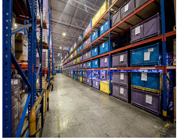
คลังสินค้า