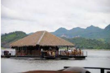
บ้านเดี่ยว (บ้านเรือนแพ)