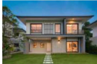
บ้านเดี่ยว