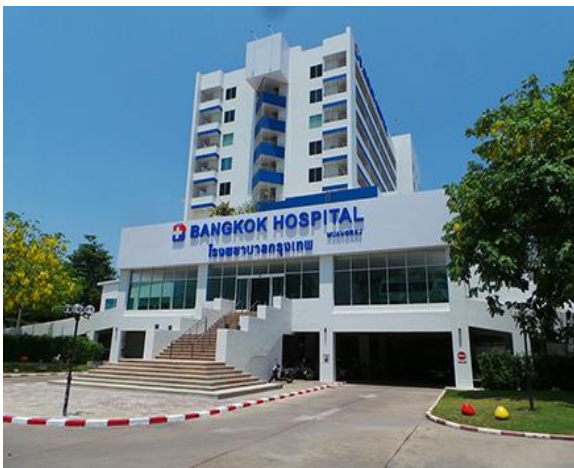
สถานพยาบาล