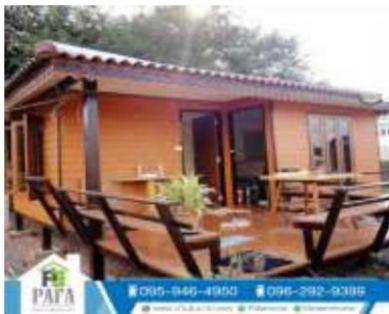
บ้านเดี่ยว (ประกอบสำเร็จ)